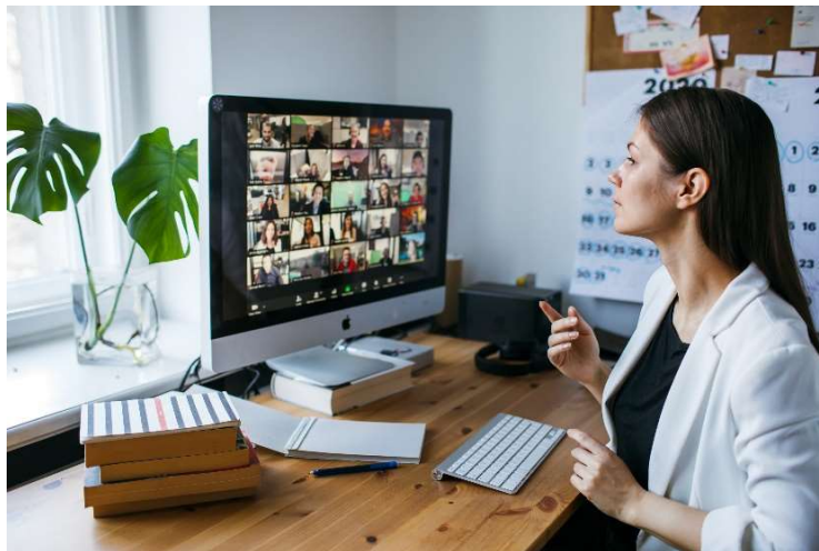
3. Beschikken over digitale functionaliteiten, zoals een computer of smartphone, is een voorwaarde voor blended ondersteuning.

In het benutten van digitale functionaliteiten is het in de ervaring van de geïnterviewde sociaal professionals daarnaast noodzakelijk dat cliënten beschikken over de ICT-middelen (een computer of smartphone) en de vaardigheden om deze te gebruiken. Kenmerkend voor cliënten van sociaal werk is dat zij zich in een kwetsbare positie of fase bevinden en het bezit van laptop en smartphone juist voor hen niet altijd vanzelfsprekend is. Hiervoor zijn zij soms afhankelijk van (gemeentelijke) subsidies of regelingen. Het is in de ogen van de geïnterviewden daarnaast van belang dat er een plek is, bijvoorbeeld in de wijk, waar mensen terecht kunnen voor vragen over het gebruik van ICT. In de geboden ondersteuning op dit vlak wordt momenteel veel gesteund op vrijwilligers.