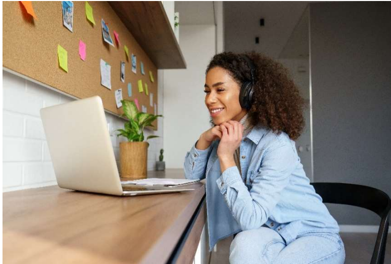
4. Blended ondersteuning als een gezamenlijk experiment met veel lef en lol.

gebruiken van de digitale functionaliteiten. Dit betreft zowel ondersteuning bij technische problemen als een training in het gebruik van bijvoorbeeld het online leerplatform. Hierbij blijkt uit ons onderzoek ook dat professionals vinden dat ze geschoold moeten worden in professionele oordeelsvorming en daarbij leren om samen te werken met cliënten bij het vinden van de juiste mix van online en face-to-face methodieken. Daarnaast blijkt uit ons onderzoek dat het noodzakelijk is dat cliënten beschikken over de digitale middelen en vaardigheden die hiervoor nodig zijn. Dit terwijl het sociaal werk vooral opereert in sociaal kwetsbare wijken met sociaal kwetsbare gezinnen waar niet iedereen over een laptop of smartphone kan beschikken.