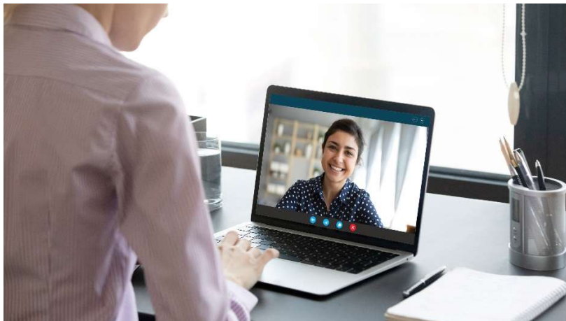
1. Binnen blended ondersteuning wordt vooral gezocht naar de optimale mix van online toepassingen en face-to-facecontact.

'Digitale onderdelen toevoegen aan de traditionele face-to-face manier van ondersteunen, en dan vooral bij de inschrijving.'