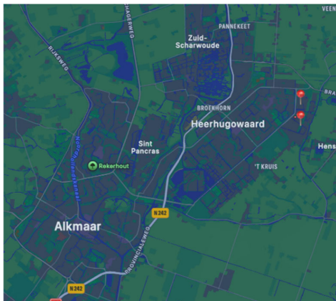
Afbeelding 1. Ligging van de woningbouwprojecten De Klamp en De Tuinfluiter in de gemeente Dijk & Waard.

Er is al meer bekend over community building in nieuwbouwbuurtten. In het Utrechtse rapport ‘Stenen maken nog geen buurt’ (Chaigneau, 2023) staat beschreven dat er rond de verhuizing van mensen diverse processen spelen. Mensen leren zich bij een verhuizing allerlei nieuwe gebruiken en patronen aan, die passen bij de nieuwe leefomgeving. De eerste maanden zijn ze vooral bezig met het klaarmaken van de eigen woning. Een verhuizing is ook een natuurlijk moment voor mensen om met elkaar in contact te komen en er ontstaat voor bewoners een zoektocht naar gedeelde normen en waarden. Na een aantal maanden neemt de interesse van bewoners in hun omgeving toe (Chaigneau, 2023). In ons leertraject hebben we inzichten opgedaan over hoe professionals dit soort processen ondersteunden in twee nieuwbouwbuurtten in de gemeente Dijk & Waard. Dit waren de woonprojecten De Klamp en De Tuinfluiter. Bijzonder aan deze twee projecten is dat op beide plekken mensen kwamen wonen waarvan bekend was dat zij een ondersteuningsvraag hadden.